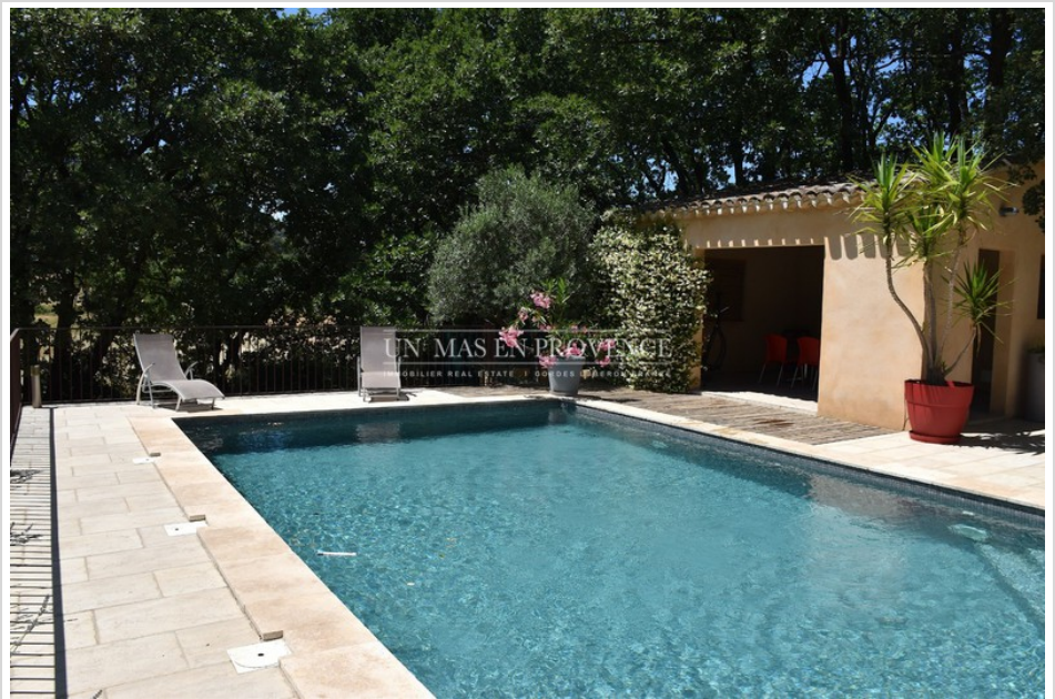
Maison Réf. : V2549M Maubec

Document non contractuel 13/05/2024 - Prix T.T.C